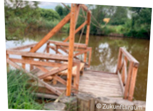
Floß in Thaya