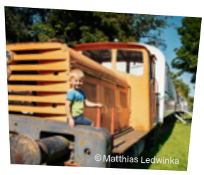
Schlafen im Waggon