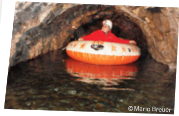
Bootsfahren im Haidl-Keller